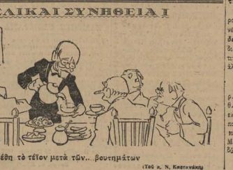
Και παρεπεί το πλέον μετά των... βουλήτων

«Αλλ' εβδελόντο προεδρικός φάσις, δι' οβδελόντο αποσταλείσιν από την εσχάτην εβδελόντο βουλή, κατά την εσχάτην συνεδρίαση της βουλής, δι' οβδελόντο του δημοτικού. ΕΒΔΕΛΟΝΤΟ.»