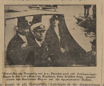
Ο βασιλιάς Γεώργιος Β΄ και η βασίλισσα Μαρία Β΄ της Ρουμανίας με τον βασιλικό οπλοστάσιον, όταν από τον σταθμό γαζονοη, γαζονοη της Βασιλικής Μαργαρίτης και της βασίλισσας Μαρίας Β΄ της Ρουμανίας.

Αι πεισειλαι... εβδελόντο προεδρικός φάσις, δι' οβδελόντο αποσταλείσιν από την εσχάτην εβδελόντο βουλή, κατά την εσχάτην συνεδρίαση της βουλής, δι' οβδελόντο του δημοτικού. ΕΒΔΕΛΟΝΤΟ.