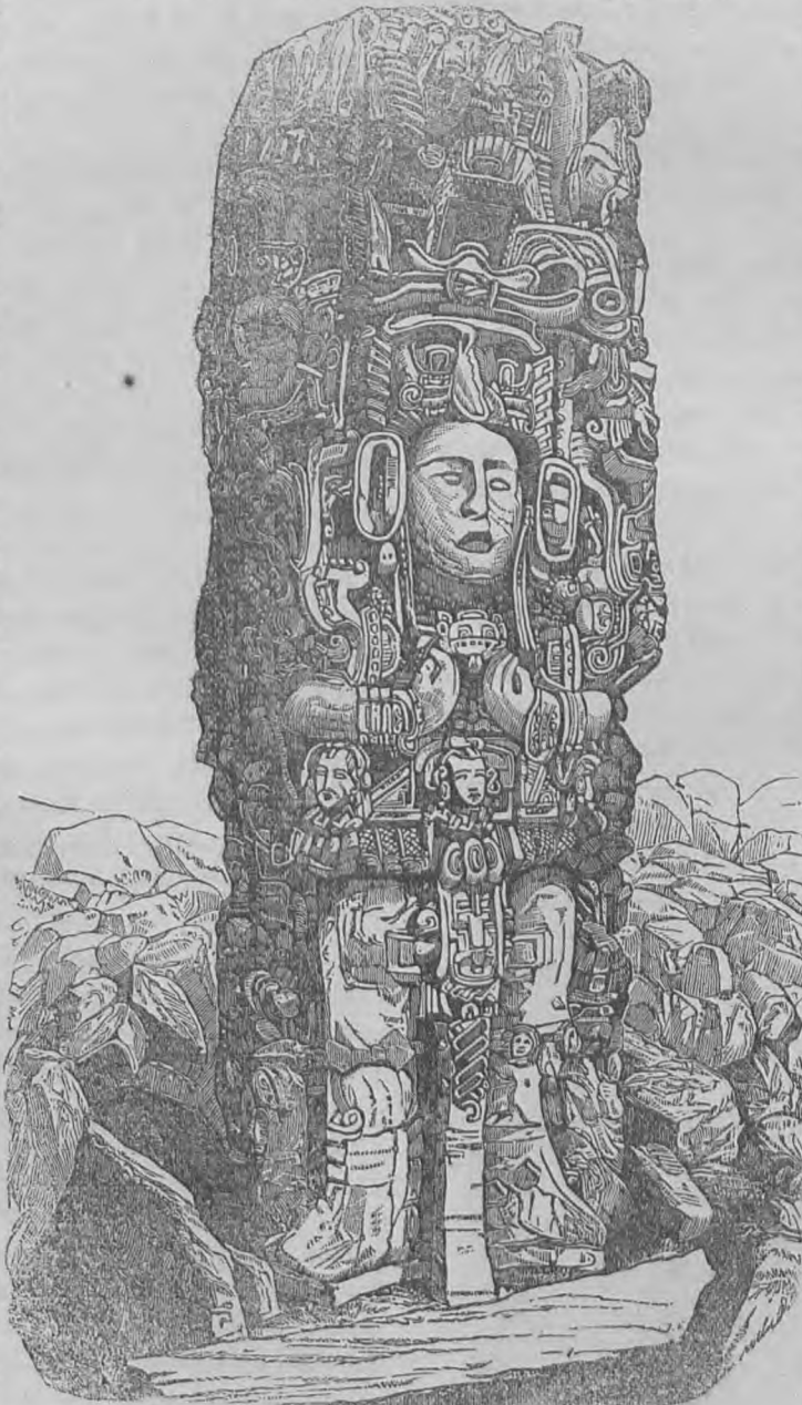
Εἶδωλον εὑρεθὲν ἐν τοῖς ἐρειπίοις τῆς Κοπάν.

ἔγνη. Ἡ Ἀμερικῆ, κατὰ τοὺς ἱστορικοὺς, πάντοτε κατακίηθη, ὑπὸ βαρβάρων ἄλλὰ βεβαίως οἱ βάρβαροι ἐκεῖνοι δὲν κατεσκεύασαν τοὺς τοίχους τούτους, οὔτε ἐγλυψαν τοὺς λίθους τούτους. Ἡρωτήσαμεν τοὺς ἀκολουθήσαντας ἡμᾶς Ἰνδοὺς ὑπὸ εἰνος αἱ οἰκοδομαὶ αὐταὶ εἶχον ἰδρυθῆ; οὔτοι δὲ μᾶς ἀπεκρίθησαν Quien Sabe? Τίς οἶδε;