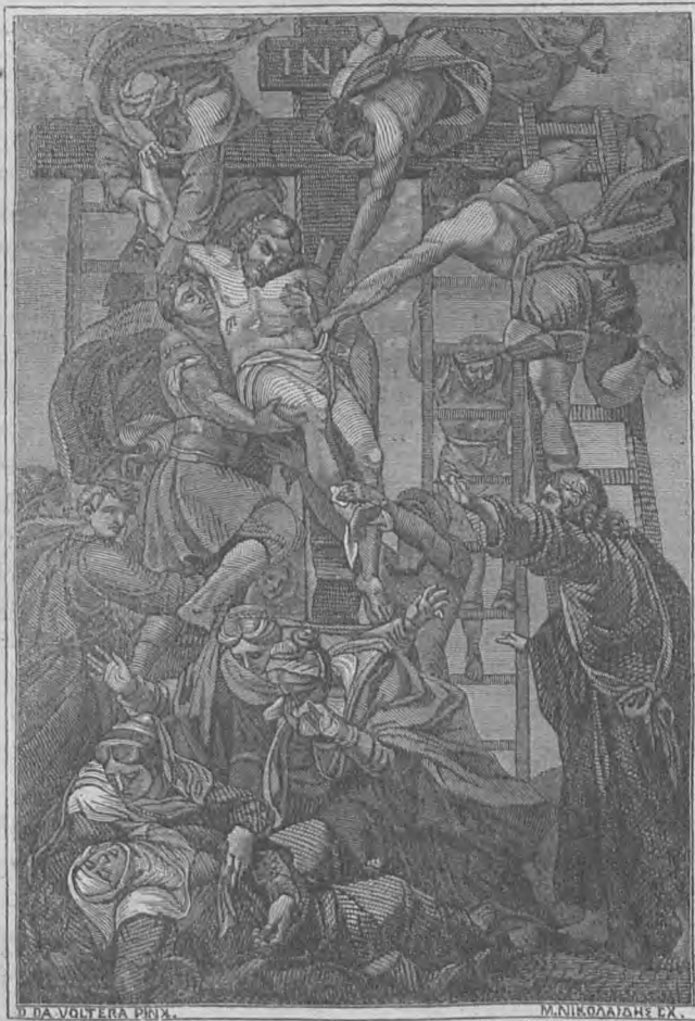
Η ΑΠΟΚΑΘΗΛΩΣΙΣ ΤΟΥ ΙΗΣΟΥ ΧΡΙΣΤΟΥ.

Ἴσον τῆς κατὰ τοῦ Σωτῆρος Ἰησοῦ Χριστοῦ, τοῦ γεννηθέντος ἐκ τῆς Παρθένου θεοτόκου Μαρίας, δοθείσης ἀποφάσεως ὑπὸ Ποντίου Πιλάτου, ἡγεμόνος τῆς Ἰουδαίας, κατὰ τὸ 17 ἔτος τῆς Βασιλείας Τιβερίου Καίσαρος Αὐτοκράτορος Ρωμαίων, κατακρίσεως αὐτὸν εἰς θάνατον σταυρικὸν ἐν μέσῳ δύο ληστῶν Μαρτίου 23, ὅπως εὑρέθη εἰς τὴν πόλιν Ἀκουλαν τῆς Ἰταλίας ἐντὸς πέτρας ὠραισιτάτης, ἐν σιδηρῷ κιβωτίῳ, ἐν ᾧ ἦν ἕτερον κιβώτιον μαρμαρινὸν θαυμαστόν, ἔχον ἐγκλεισμένην τὴν ἀπόφασιν ταύτην, ἑβραϊκοῖς γράμμασι γεγραμμένη ἔχουσαν οὕτως.