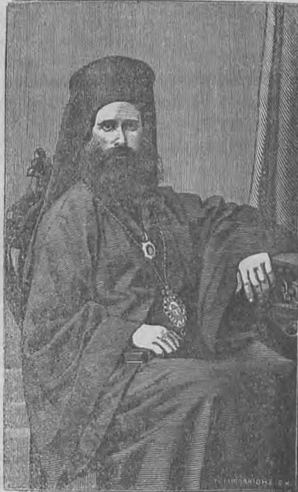
Ὁ Κυζίκου Νικόδημος.

Γεννηθεὶς ἐν Κωνσταντι- νουπόλει, ἀγεί τὸ 46ον ἔτος. Ἐσπούδασε τὰ πρῶτα γράμ- ματα ἐν τῷ τῆς Φειδαλίας κόλπῳ (Μπογιατζῆ κιδί), χωρὶς τοῦ Βοσπόρου, ὅπου εἶχον μεταβῆ οἱ γονεῖς Αὐ- τοῦ μετὰ τὴν τότε μεγάλην τοῦ Σταυροδρομίου πυρκαϊάν.