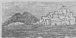
Νῆσος καὶ πόλις τοῦ Αἰγαίου