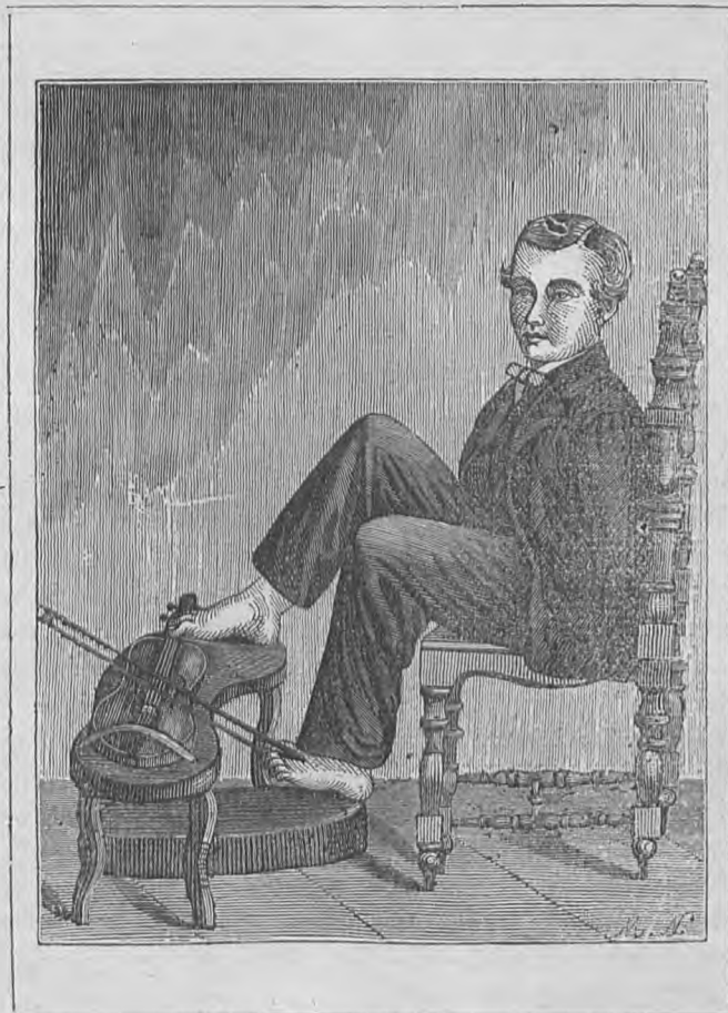
Ὁ ἀνευ χειρῶν μουσικὸς

Ζητεῖται νὰ διαιρεθῆ ὁ ἀριθμὸς 45 εἰς τέσσαρα τοιαῦτα ἄνισα μέρη, ὥστε ἂν εἰς τὸ πρῶτον προσθέσωμεν 2, ἀπὸ τὸ δεύτερον ἀφαιρέσωμεν 2, τὸ τρίτον πολλαπλασιάσωμεν ἐπὶ 2 καὶ τὸ τέταρτον διαιρέσωμεν διὰ 2, νὰ εὐρωμεν καὶ μετὰ τὰς τέσσαρας ταύτας πράξεις τὸν αὐτὸν ἀριθμόν.