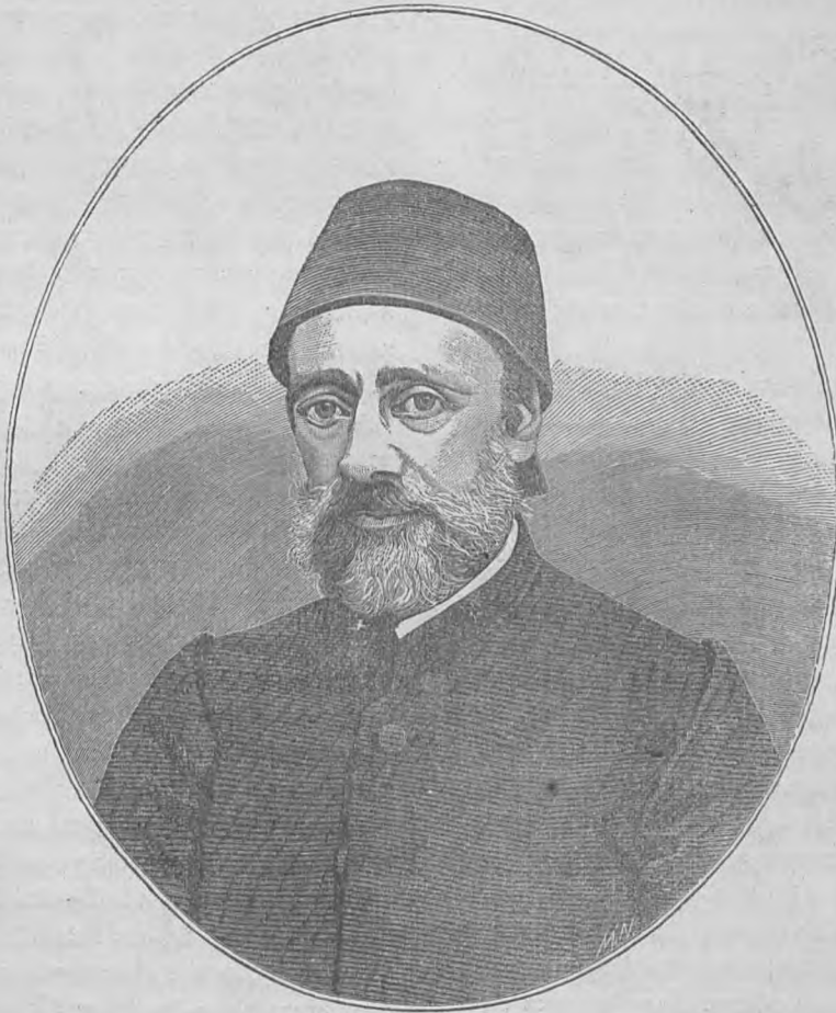
ΜΕΧΜΕΤ ΕΜΙΝ ΑΛΛΗ ΠΑΣΣΑΣ ὁ Μ. Βεζύρης.

Τῷ 1844 ἐπανελθόντα εἰς Κωνσταντινούπολιν βλέπομεν αὐτὸν ὑπηρετοῦντα ἐπὶ τινὰς μῆνας ὡς μέλος τοῦ