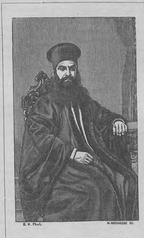
Ο ΔΕΡΚΩΝ ΝΕΟΦΥΤΟΣ.

δικούσαν καὶ μηδὲ φαντασθεῖσάν ποτε τὸ παράπαν ἀναβῆναι τὸν περίπυστον θρόνον τῶν Κυρίλλων καὶ Ἀθανασίων, ἅμα δὲ καὶ βαθέως συγκινηθέντος τὴν ψυχὴν ἐπὶ τοῖς ἀγαθοῖς περὶ ἐμοῦ καὶ χριστιανικοῖς αἰσθήμασι καὶ φρονήμασι τοῦ ὀρθοδόξου αὐτόθι πληρώματος, ἐφ' οἷς καὶ εὐγνωμονῶν ἐγκαρδίως ἀδυνατῶ διὰ λόγων παραστήσαι τὰς εὐχαριστίας μου· χεῖρας δὲ αἴρων ὑπὲρ αὐτοῦ οὐ παύσομαι ἐν ταῖς πρὸς Θεὸν ταπειναῖς μου δεήσεσι. Καθόσον δ' ἀφορᾷ τὴν γενομένην μοι κλήσιν εἰς τὴν τοῦ ἀγιωτάτου τούτου θρόνου διαδοχὴν, εἰς ἣν καὶ ἡ υἱικὴ Αὐτῆς ἀγάπη ὑπὸ διαθέσεως εὐμενοῦς καὶ ἐπ' ἐλπίσι χρησταῖς προτρέπει με, ταύτην ἐγὼ θεωρῶν οὐ μόνον ἀνωτέραν τῶν δυνάμεών μου,