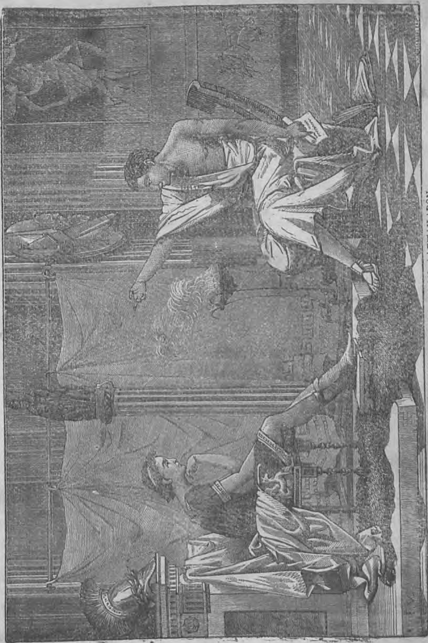
Ο ΑΡΙΣΤΟΤΕΛΗΣ ΔΙΔΑΣΚΩΝ ΤΟΝ ΑΛΕΞΑΝΔΡΟΝ.