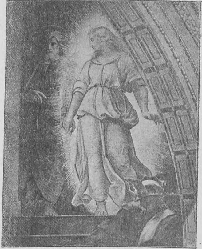
Ἡ ἐκ τῆς φυλακῆς θυμασία ἀπολύτρωσις τοῦ Ἀπ. Πέτρου. (Πράξ. ιβ', 5 καὶ ἐξῆς).

«Σπουδάζετε λοιπόν, φιλόμουσοι νέοι, τὰς ὑμετέρας σπουδὰς μετὰ προσοχῆς καὶ μεθόδου καὶ ὠφελείας πραγματικῆς, ἐπιμελούμενοι πάντοτε νὰ στολίσητε καθὼς τὴν γλῶσ-