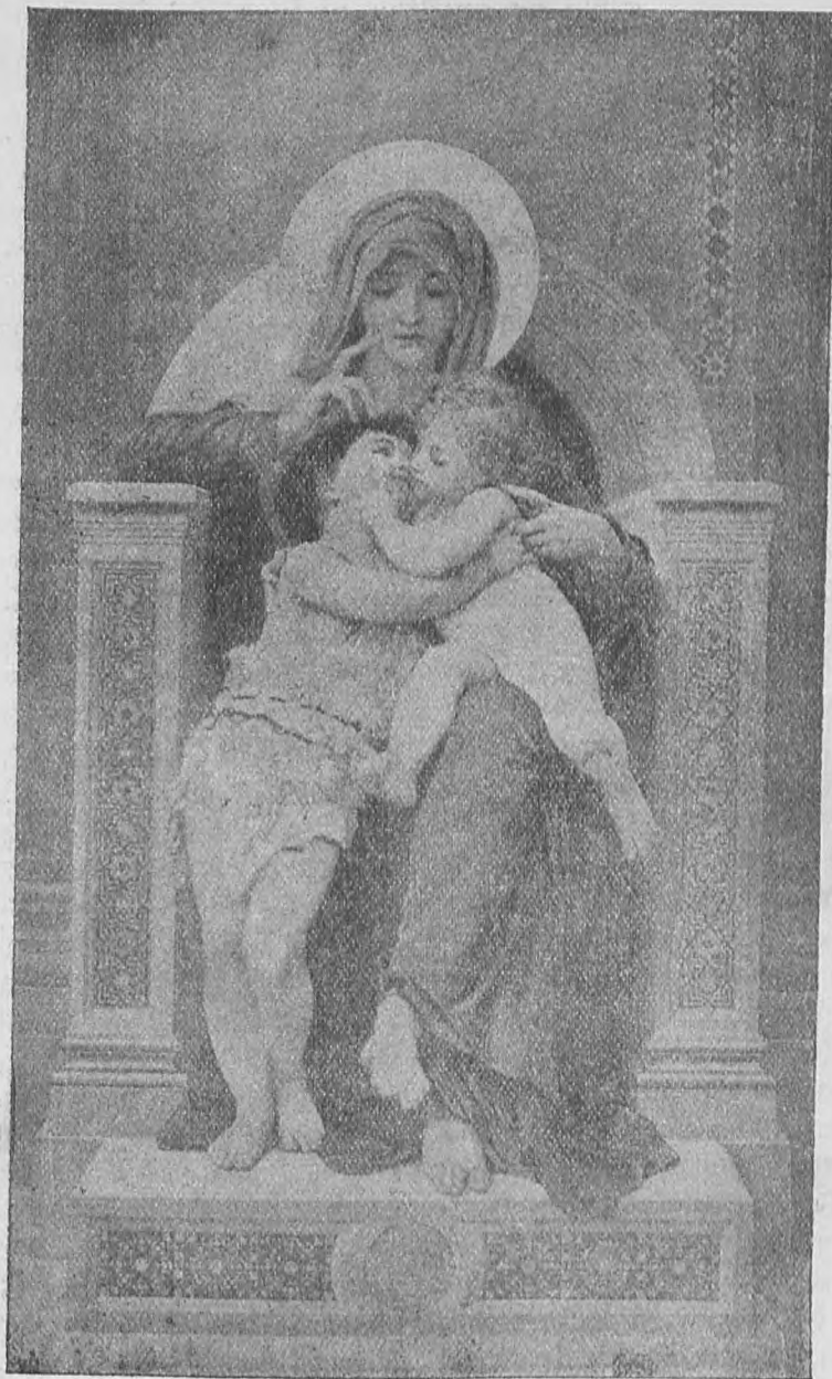
Η ΠΑΡΘΕΝΟΣ, ΤΟ ΘΕΙΟΝ ΒΡΕΦΟΣ ΚΑΙ Ο ΠΡΟΔΡΟΜΟΣ

ΕΤΟΣ Α' | ΣΜΥΡΝΗ 31 Δεκεμβρίου 1911 | ΑΡΙΘ. 39