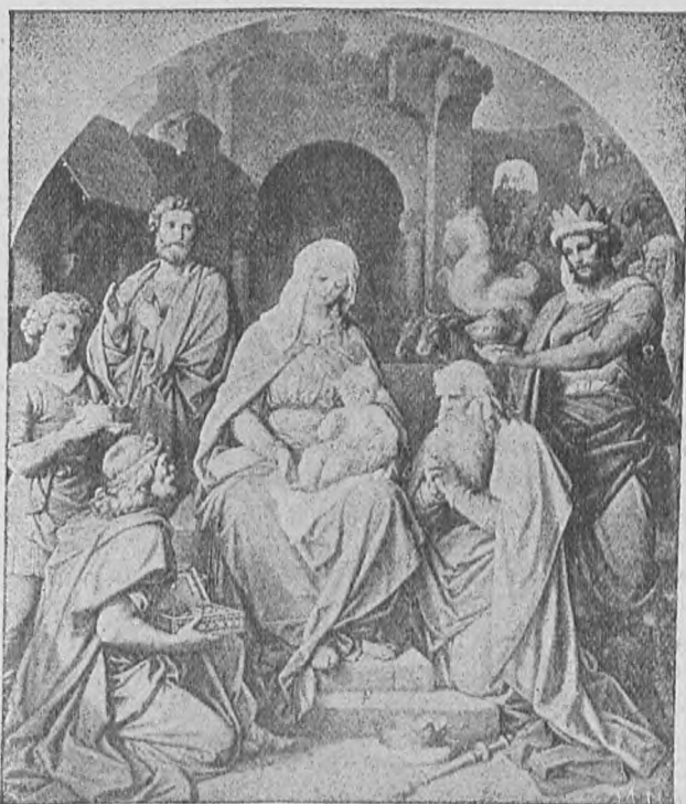
«Σὲ προσκυνῶσα τάξις ἔθνικῆ. Λόγε, Τὸ πρὸς Σὲ δηλοῖ τῶν Ἐθνῶν μέλλον σέβας.»

σισμένοι νὰ ἐνεργήσωσιν ἔρευανὰ ποτελεσματικὴν. Πρέπει νὰ εὕρωσι καὶ προσκυνήσωσι τὸ ἐν τῇ φάτνῃ ἐσπαργανωμένον παιδίον, τὸν Μεσσίαν τοῦ Ἰσραήλ. Μετὰ πολὺν θόρυβον ἀφυπνίζονται οἱ τοῦ ἀρχισυναγώγου, ὡς καὶ πολλοὶ τῶν γειτόνων. Ἐρωτῶσι τί συμβαίνει; καὶ μνησθάνουσιν ὅτι εἰποιμένες ἐπληροφόρηθησαν παρ' ἀγγέλων ὅτι τὴν αὐτὴν ἑκείνην νύκτα ἐγεννήθη