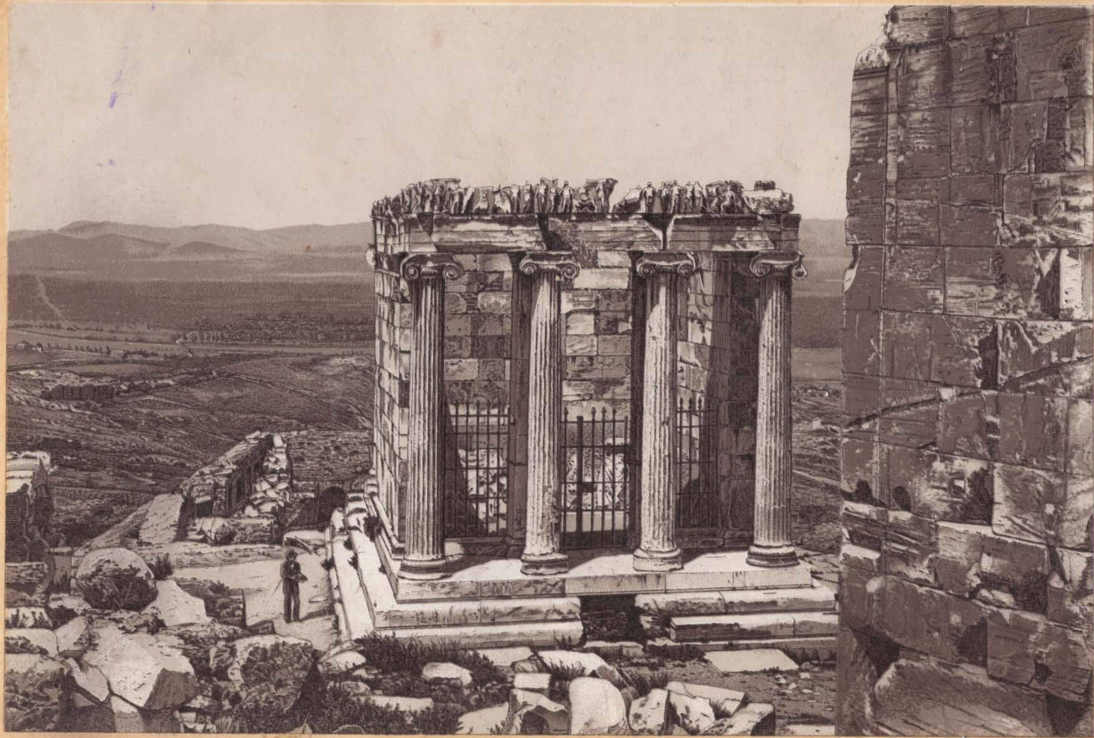
ΝΑΟΣ ΑΠΤΕΡΟΥ ΝΙΚΗΣ.