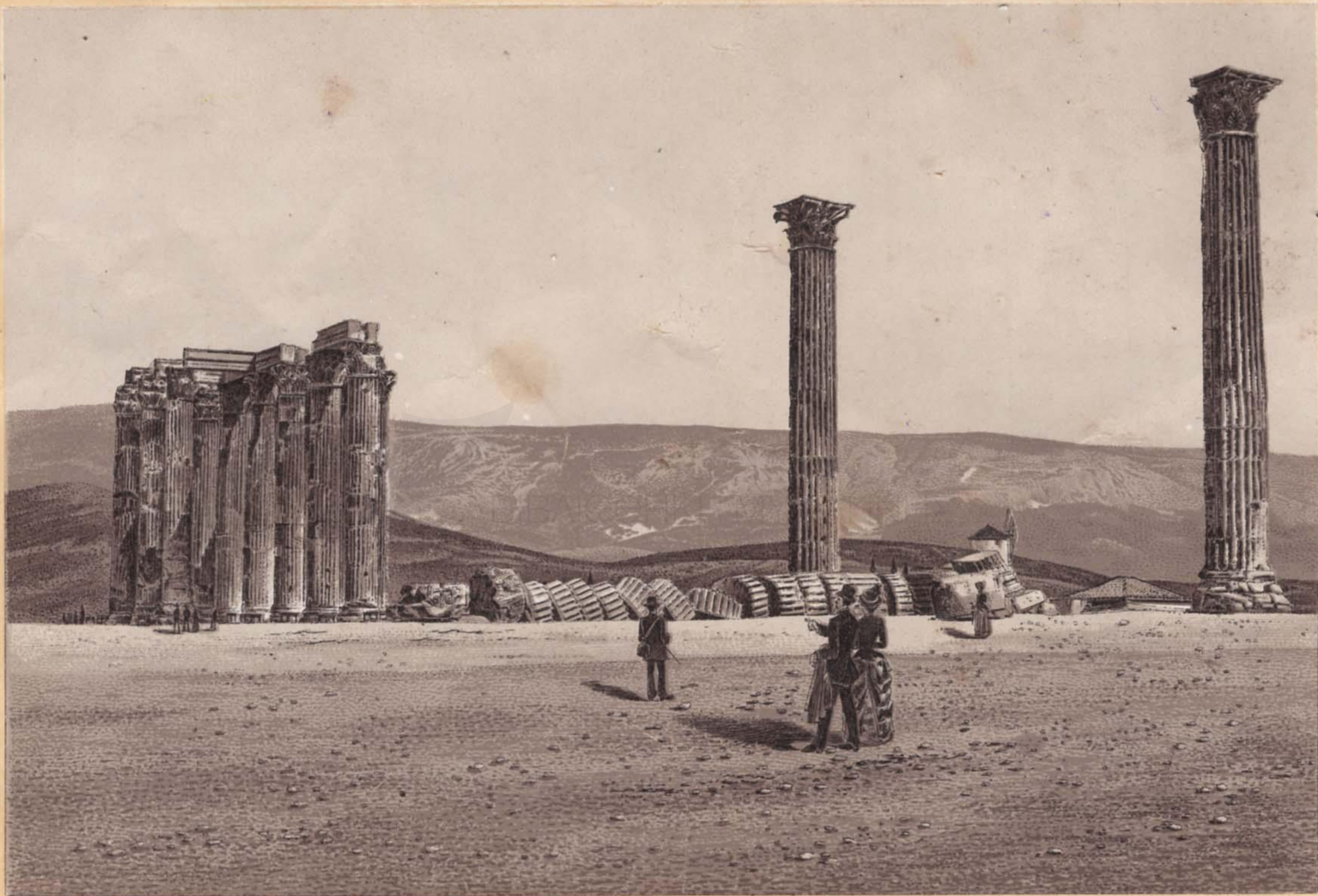
ΣΤΥΛΟΙ ΟΛΥΜΠΙΟΥ ΔΙΟΣ.