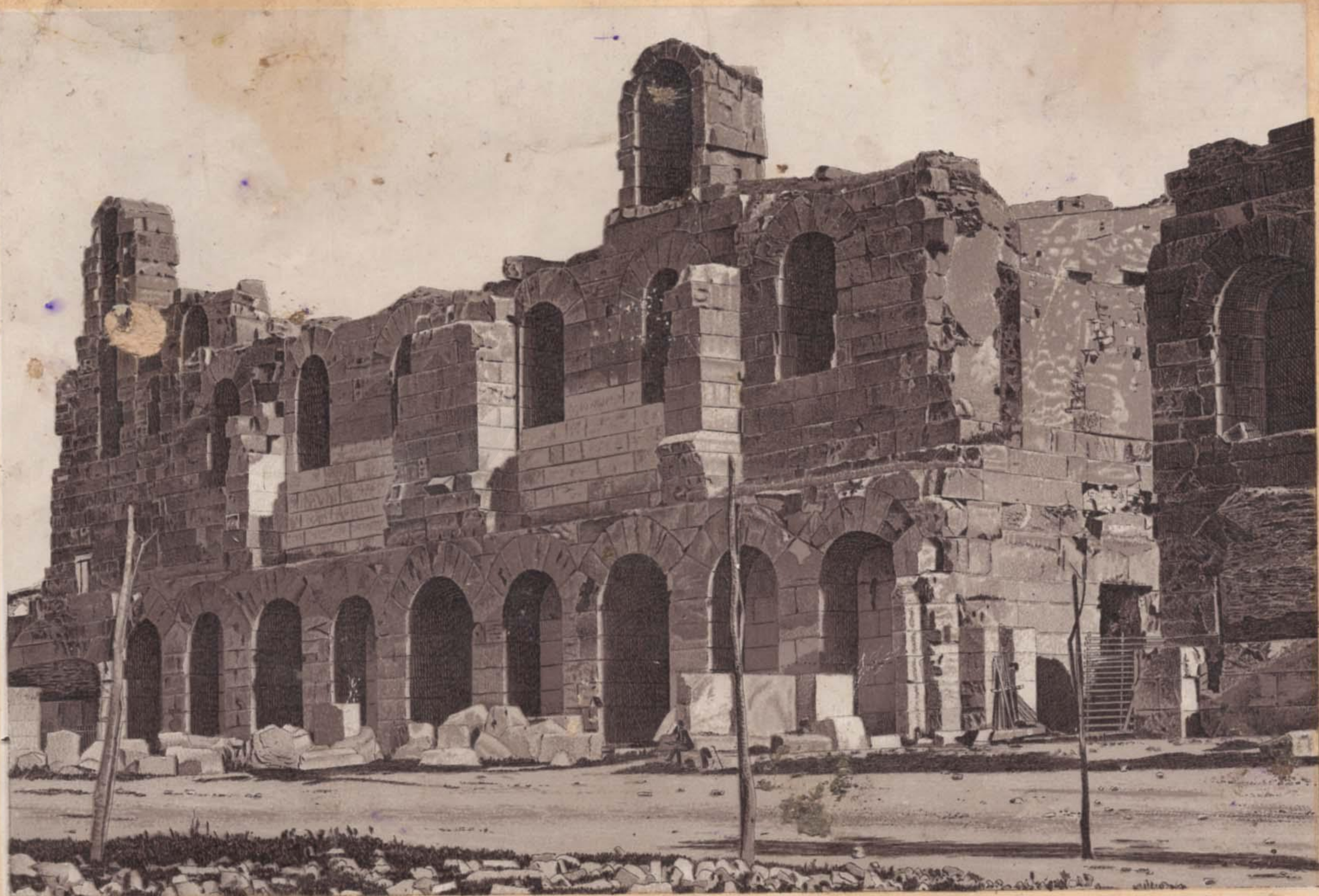
ΘΕΑΤΡΟΝ ΗΡΩΔΟΥ ΑΤΤΙΚΟΥ.