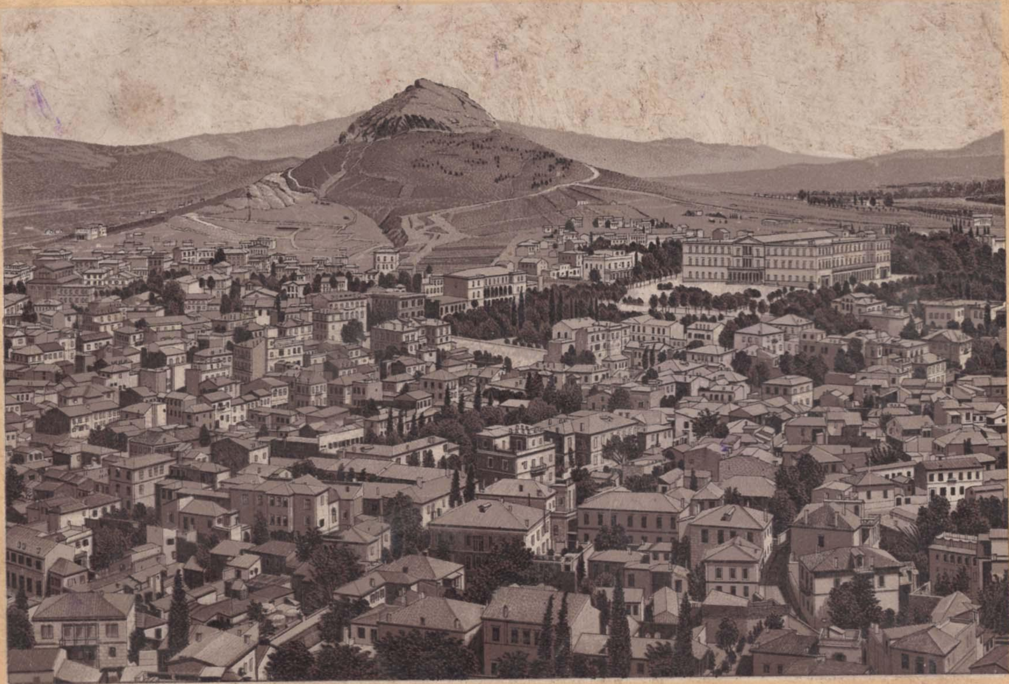
ΠΟΛΙΣ ΤΩΝ ΑΘΗΝΩΝ.