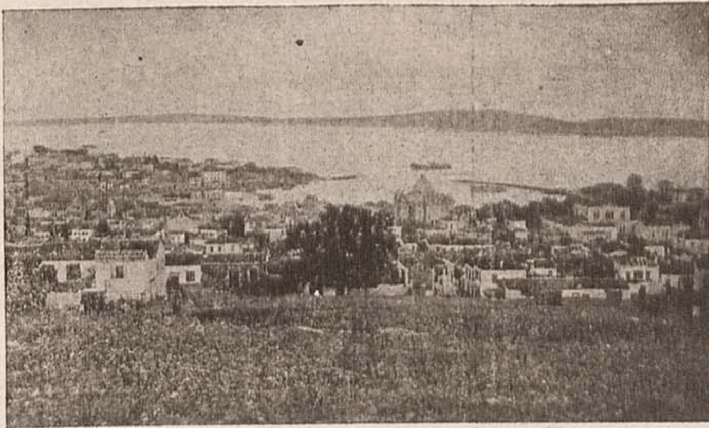
"Αποψις τοῦ λιμένος.

ἐκεῖ πού πρέπει, ἔλεγεν ὁ Κουβάλδης, σπρώχνων διὰ χειρονομίας τοὺς κλητήρας πού ἔτρεξαν πλησίον του.