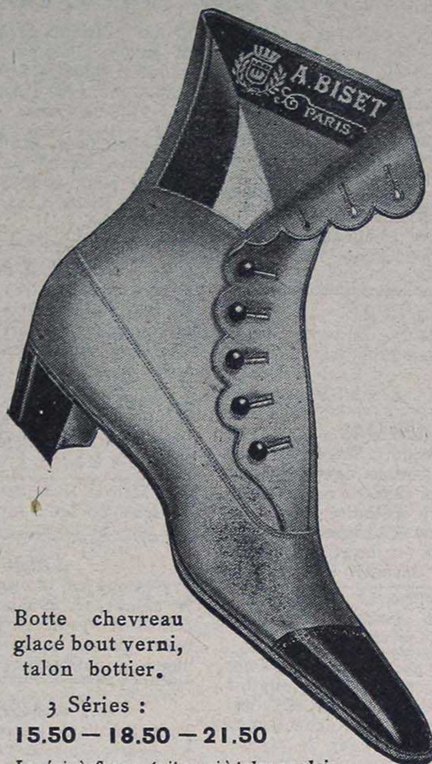
Botte chevreau glacé bout verni, talon bottier.