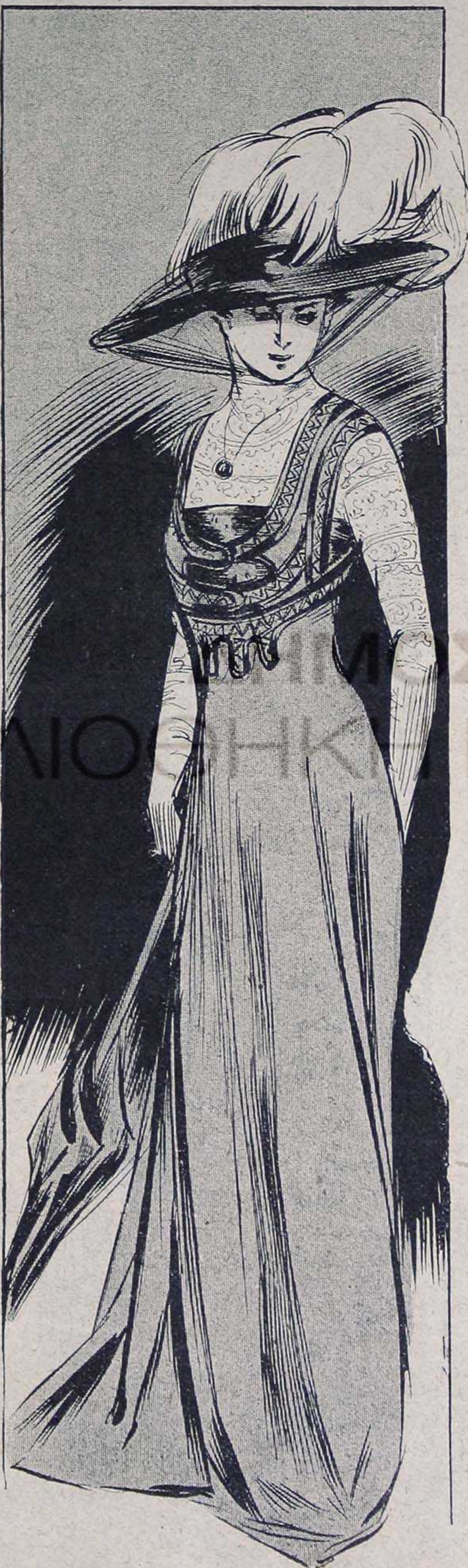
(Modèle de Mme Monge, 18, Chaussée d'Antin.)

A TOUTES les époques, les femmes élégantes et de goûts délicats ont passionnément aimé la dentelle. Depuis un certain nombre d'années, tant d'imitations réellement fort jolies ont été créées que le rôle de la vraie dentelle dans la toilette a diminué. L'importance des garnitures, l'aunage plus ou moins exact de la dentelle nécessaire pour telle ou telle façon, surtout le joli effet de l'imitation dans son neuf, avaient fait accepter ce que nos mères n'eussent jamais consenti à admettre au rang de la parure. Il était beaucoup plus commode