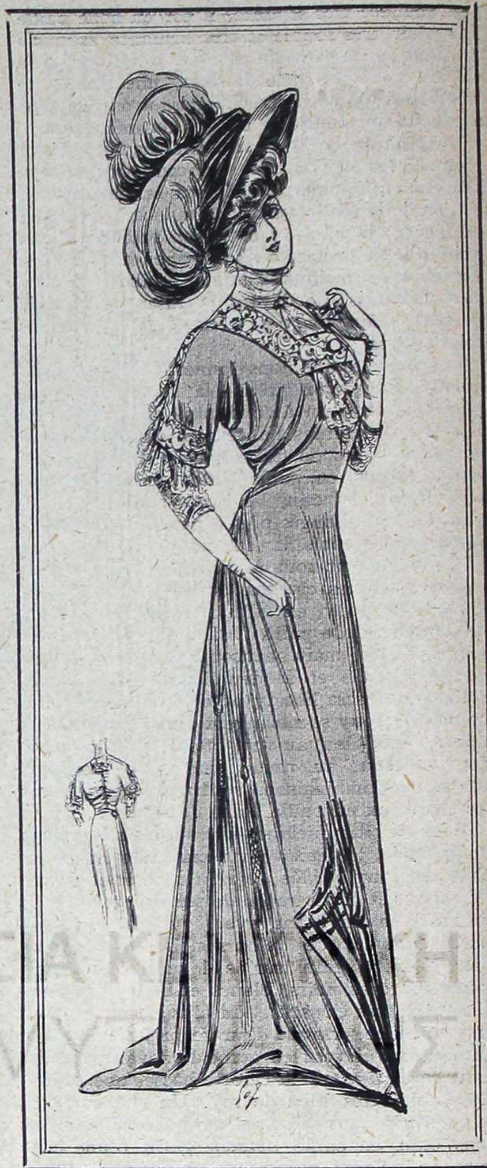
N° 14. EN PROMENADE

Toilette en linon ou mousseline légère incrustée d'entre-deux et de petits plis. Corsage décolleté ouvert en fichu. Fichu Marie-Antoinette en taffetas bleu très souple, à longs pans, ruchés autour Charlotte Corday en dentelle ruban bleu, roses France. En-cas bleu.