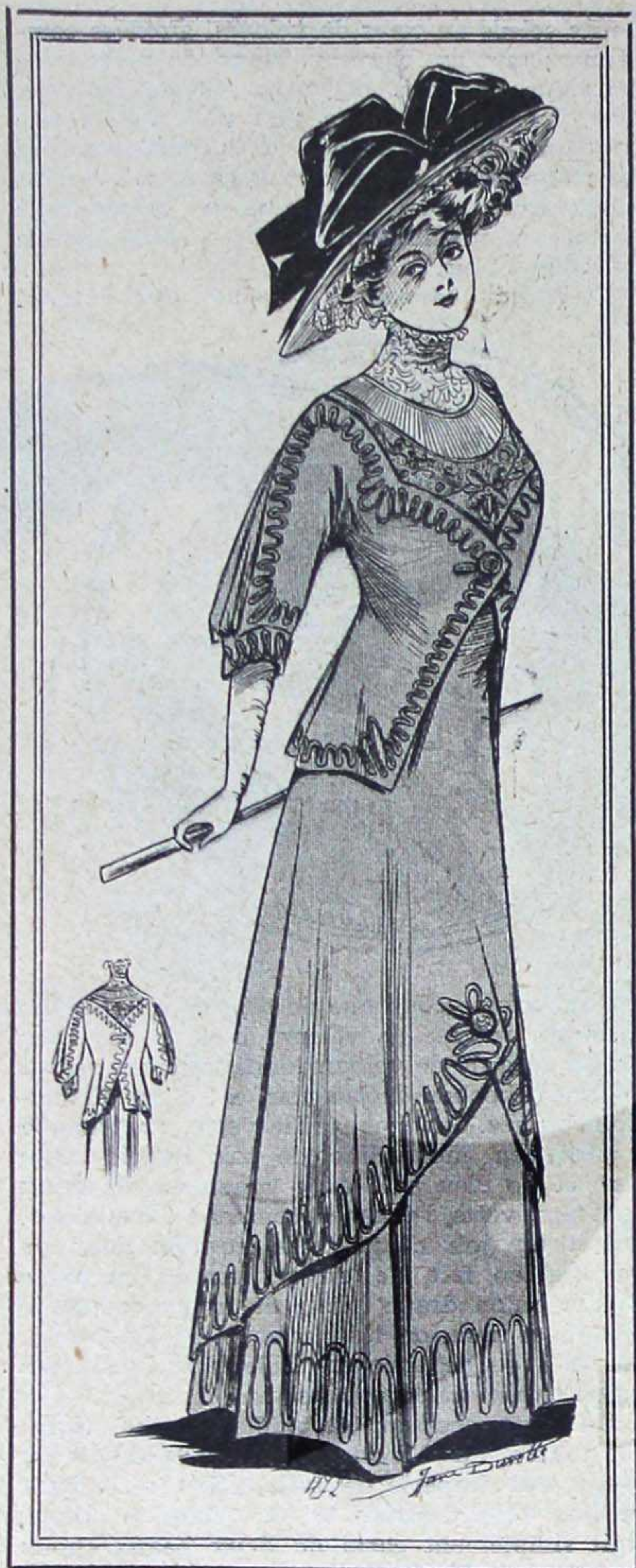
N° 12. TROTTEUR ÉLÉGANT

En toile tussor bleu Nattier, jupe à plis, broderie à même cernée de bleu, intérieur de linon blanc. Cravate et col noirs. Manches en linon. Corsage et haut de manches en toile tussor Nattier. Ceinture brodée. Chapeau Italie vieillie garni vert.