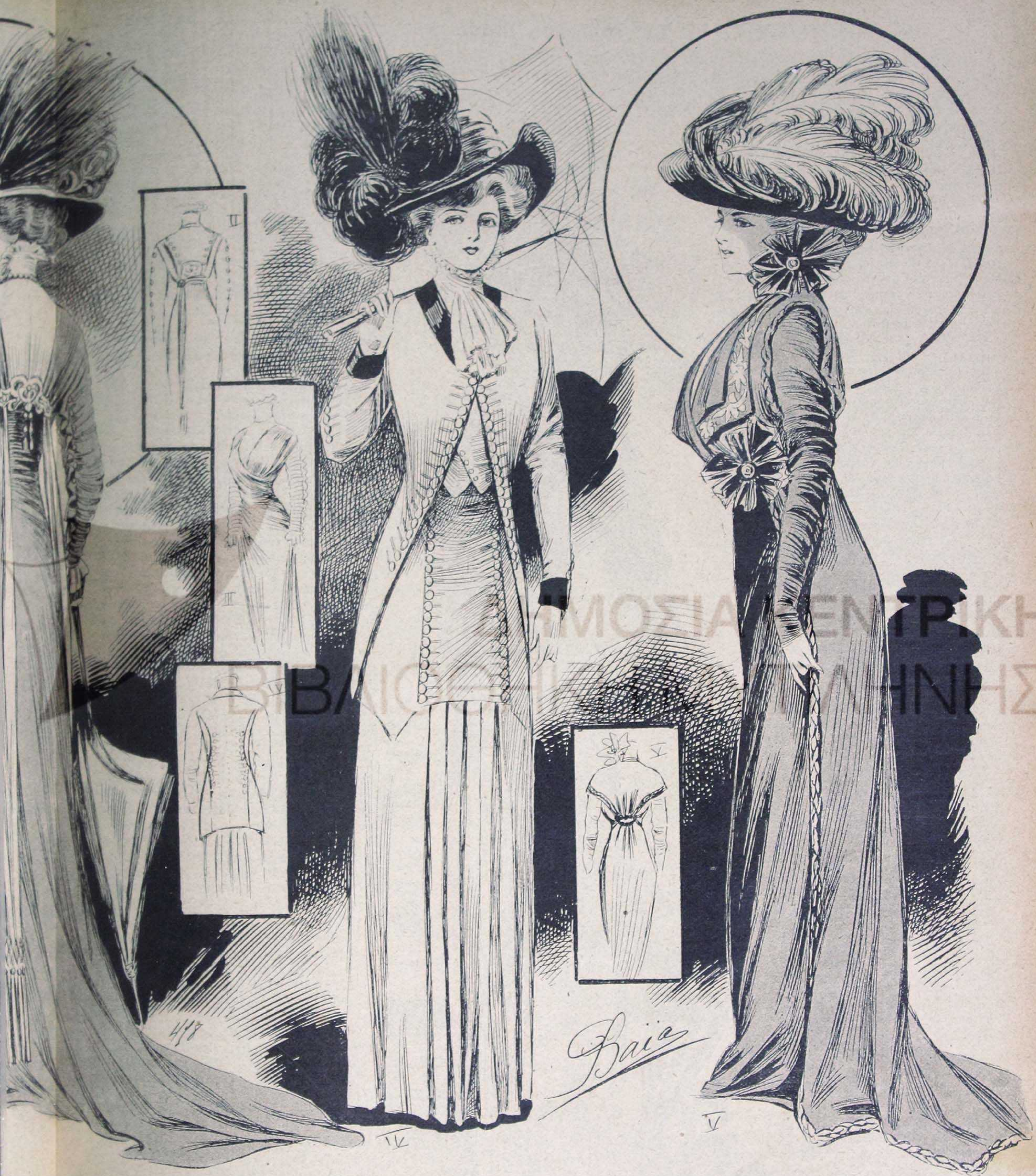
aigrettes noires. — IV. Toilette en tussor bleu ancien. Jupe à plis dos et devant, gros boutons cernés de noir. Gilet de piqué blanc. Jaquette en tussor passementerie bleue. Cols et revers de satin noir. Chapeau de paille, plumes et aigrettes noires. En-cas vieux rose en tussor brodé. — V. Longue robe princesse en taffetas vert brodé blanc et noir, les bords sont ornés d'un nappé de taffetas sur la jupe et les manches, mousseline de soie noire posée à plat. Nœuds de tulle au cou ou à la taille. Chapeau de tulle noir, plumes autruche naturelles.

Patrons sur mesures. Voir tarif page 19.