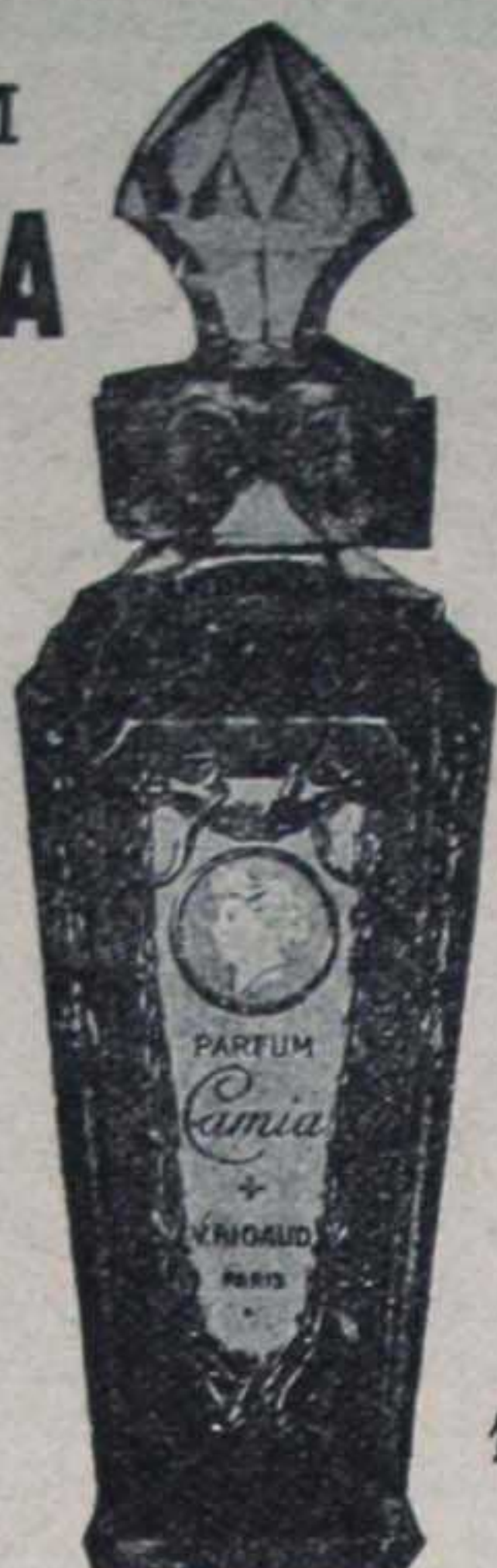
V. RIGAUD 1, Faub. St-Honoré PARIS