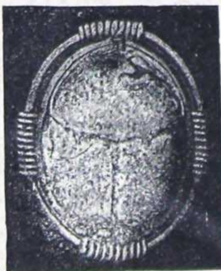
Cette épingle est montée en vermeil.