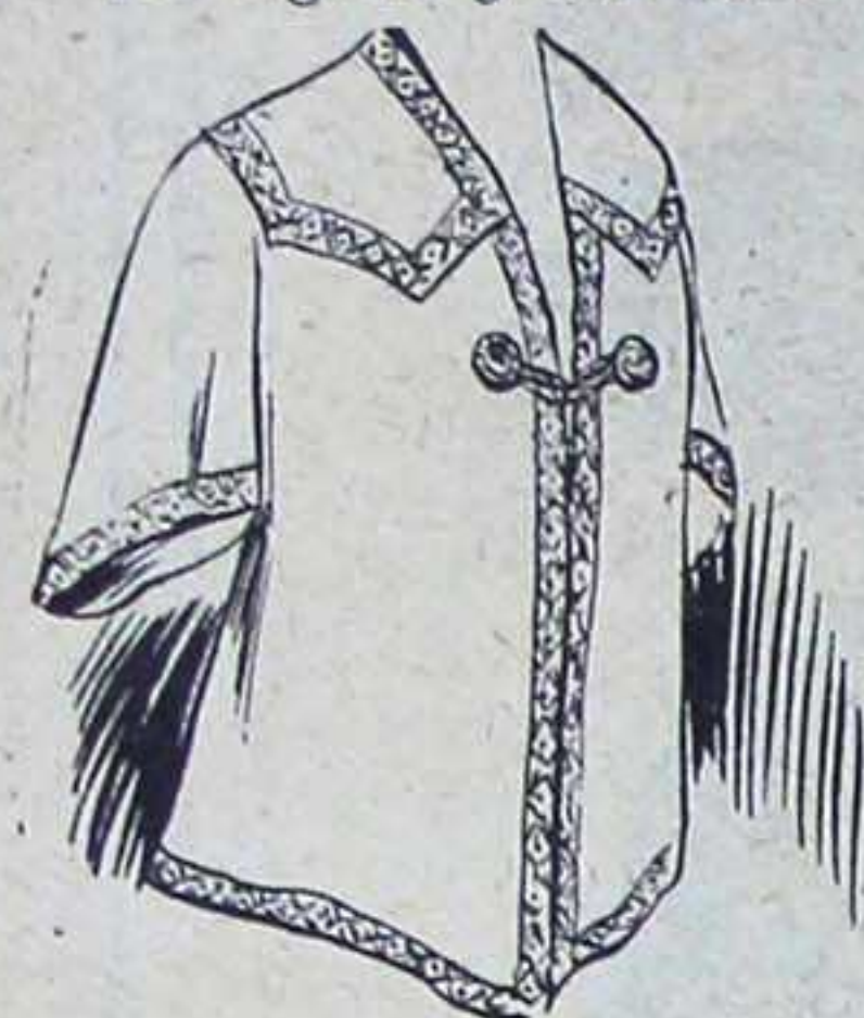
Modèle du patron tracé et découpé.

La figure 3 est celle de l'empiècement, droit fil au milieu de devant, le long de la ligne B D, pour l'élargir par le côté des épaules, le long de la ligne A C.