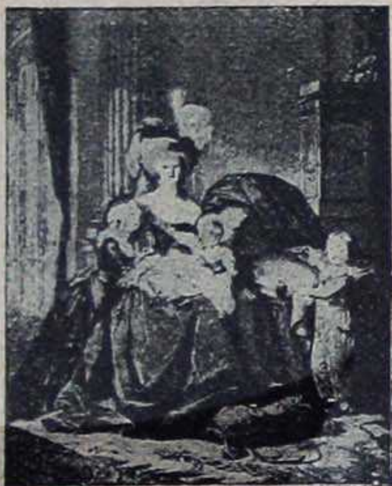
GRANDEUR SANS LES MARGES 365 x 465

Le succès de notre belle prime "MARIE-ANTOINETTE" a été tellement considérable, que nous avons dû faire procéder, en Angleterre, à un nouveau tirage de notre magnifique gravure. Ce qui nous permet de la laisser maintenant à nos fidèles acheteuses au numéro à 1 fr. 25 au lieu de 2 fr. 25. en y joignant les 6 petits bulletins pris dans six numéros consécutifs de notre journal.