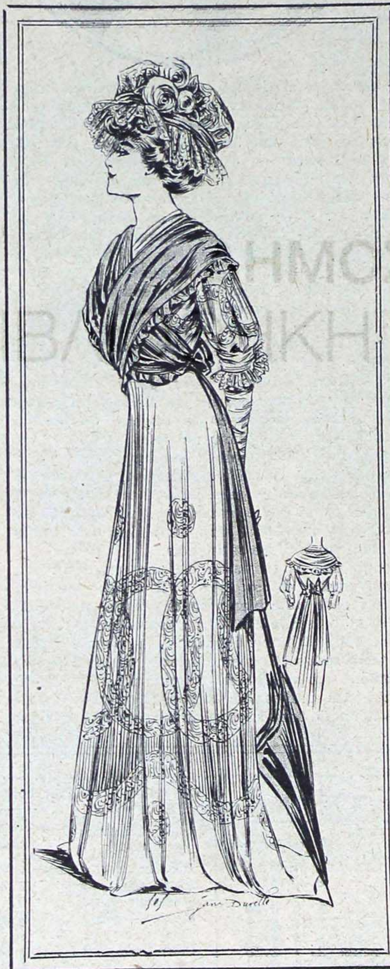
N° 13. JEUNE FILLE

Au théâtre, dans la salle des théâtres à la mode en ce moment, j'ai aperçu, dans une avant-scène, une robe d'Irlande et de Venise d'une richesse merveilleuse : c'était comme un grand fourreau de dentelle sans emmanchures marquées, laissant voir les épaules à travers les fines arabesques et donnant à la femme une allure non définie, d'un vague infiniment séduisant. Comme chapeau, une nouveauté à signaler : un crin immense chargé d'aigrettes, avec ruban de satin noir partant du chapeau et s'enroulant autour du cou pour se fixer, à droite, sous un bijou.