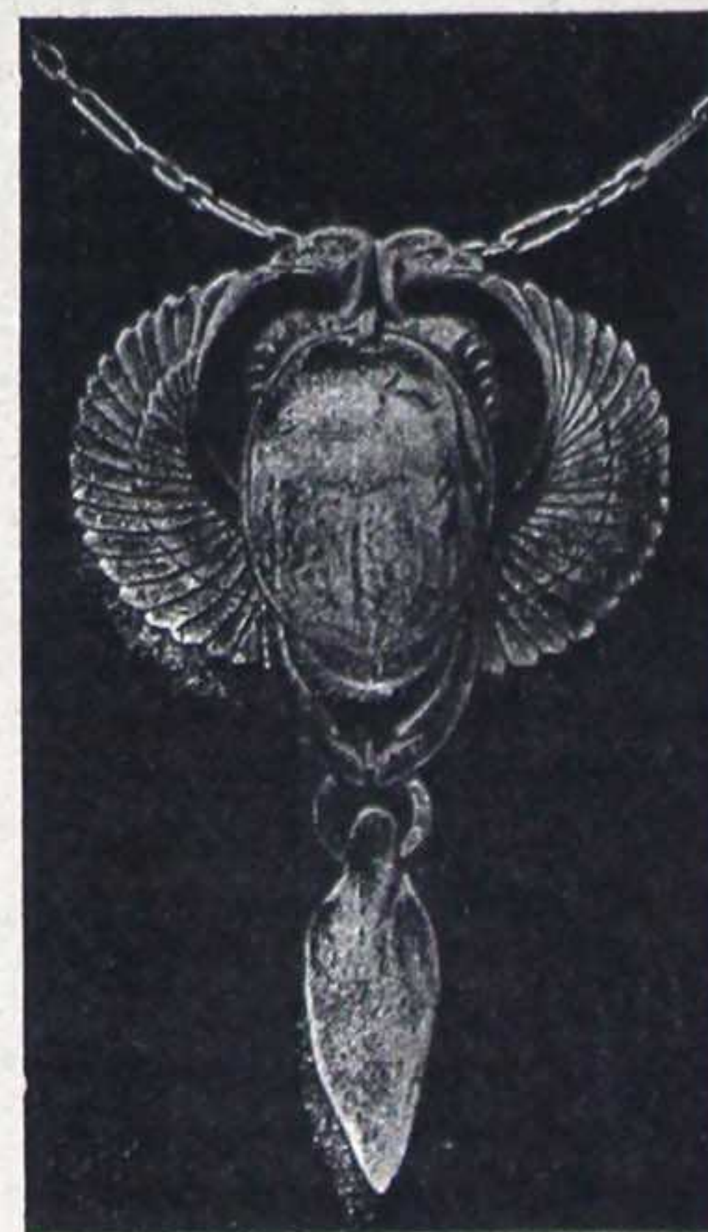
Ce bijou est monté en vermeil.

Nos abonnées à notre édition littéraire ont droit à deux de ces primes à leur choix, il en est de même pour celles recevant l'édition avec gravures en couleur. Indépendamment de l'une de ces primes, toutes nos abonnées ont droit, en ajoutant 0 fr. 80, à recevoir notre magnifique gravure anglaise: Marie-Antoinette et ses enfants , d'après Mme Vigée-Lebrun, et, si elles le désirent, un magnifique album musical contenant au moins cinquante morceaux de piano et chant des compositeurs modernes les plus en vogue; pour cet album envoyer 3 francs. Nos abonnées de l'étranger voudront bien ajouter 1 fr. pour les frais d'expédition.