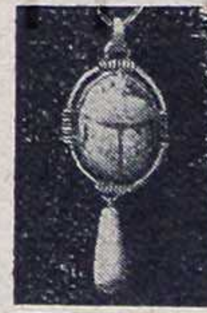
Voir leurs reproductions grandeur nature dans l'intérieur du journal.

Avez-vous un cadeau à faire ou un anniversaire à souhaiter, offrez un de nos superbes pendentifs : Le SCARABÉE EGYPTIEN , reconstitué d'après les originaux trouvés dans les tombeaux des Pharaons. Monté en vermeil contrôlé c'est un joyau de prix et il fait l'admiration de toute femme élégante.