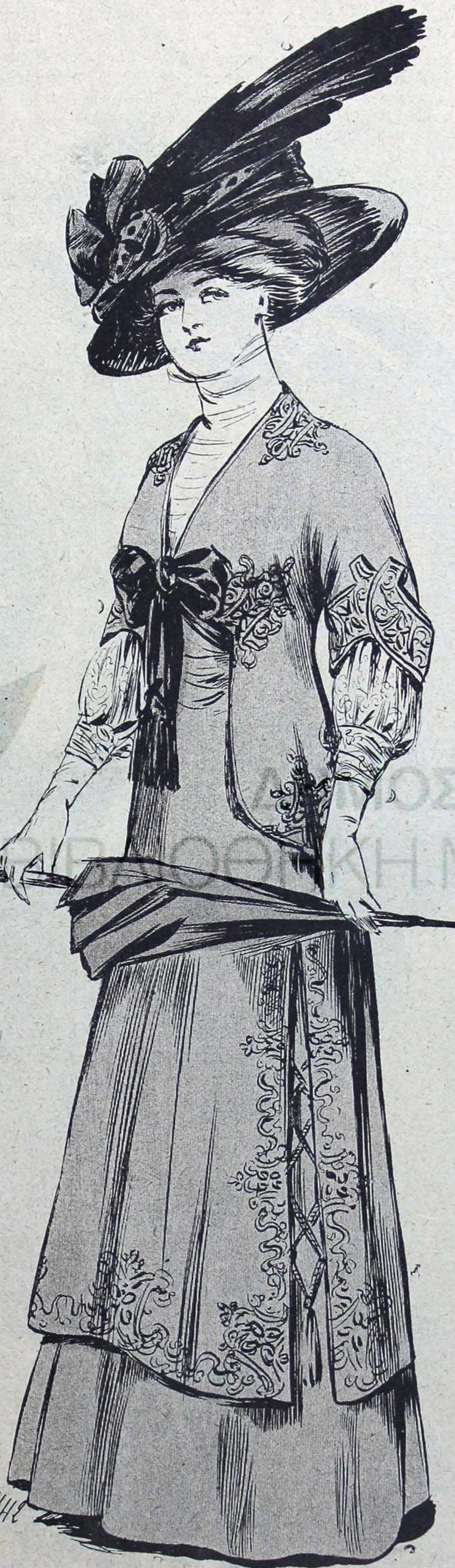
(Modèle de la maison Dauphin, Hemet et Cie, 17, passage des Princes, 5 bis, boulevard des Italiens.)

Ceux qui en ce moment ne savent pas trouver à Paris l'emploi de leur temps, n'ont vraiment pas de chance. Il faudrait que les journées eussent quarante-huit heures, pour que les gens un tant soit peu dans le train puissent seulement effleurer tous les plaisirs qui leur sont offerts. La grande semaine qui s'écoule entre les deux grands événements d'Auteuil et de Longchamp aura en somme été fort brillante et le plein air et les salons auront dignement rivalisé d'éclat et de succès. La journée du Grand Steeple-Chase a fort heureusement commencé la série; le temps est resté très agréable en dépit des menaces de la matinée et d'un vent froid; dans la tribune des dames, pas une place n'était vide; toute une symphonie de couleurs claires s'y étalait au grand jour; on admirait des robes ravissantes d'étoffes légères dont le flou vaporeux était d'un idéal raffinement. Dès une heure et demie, les voitures prenaient la file, au pas, à l'entrée des lacs, et jusque vers trois heures, le flot des arrivants se déversait encore dans l'enceinte réservée. Rien de plus joli comme le coup d'œil de la tribune présidentielle où s'épanouissaient quelques jolies toilettes. Le souci de la décoration qui s'impose de plus en plus, avait inspiré aux commissaires la galante idée de fleurir les tribunes et les loges comme une voiture de mariée, en sorte que c'était par-dessus une haie fraîche et embaumée qu'on apercevait les toilettes, tableau digne du