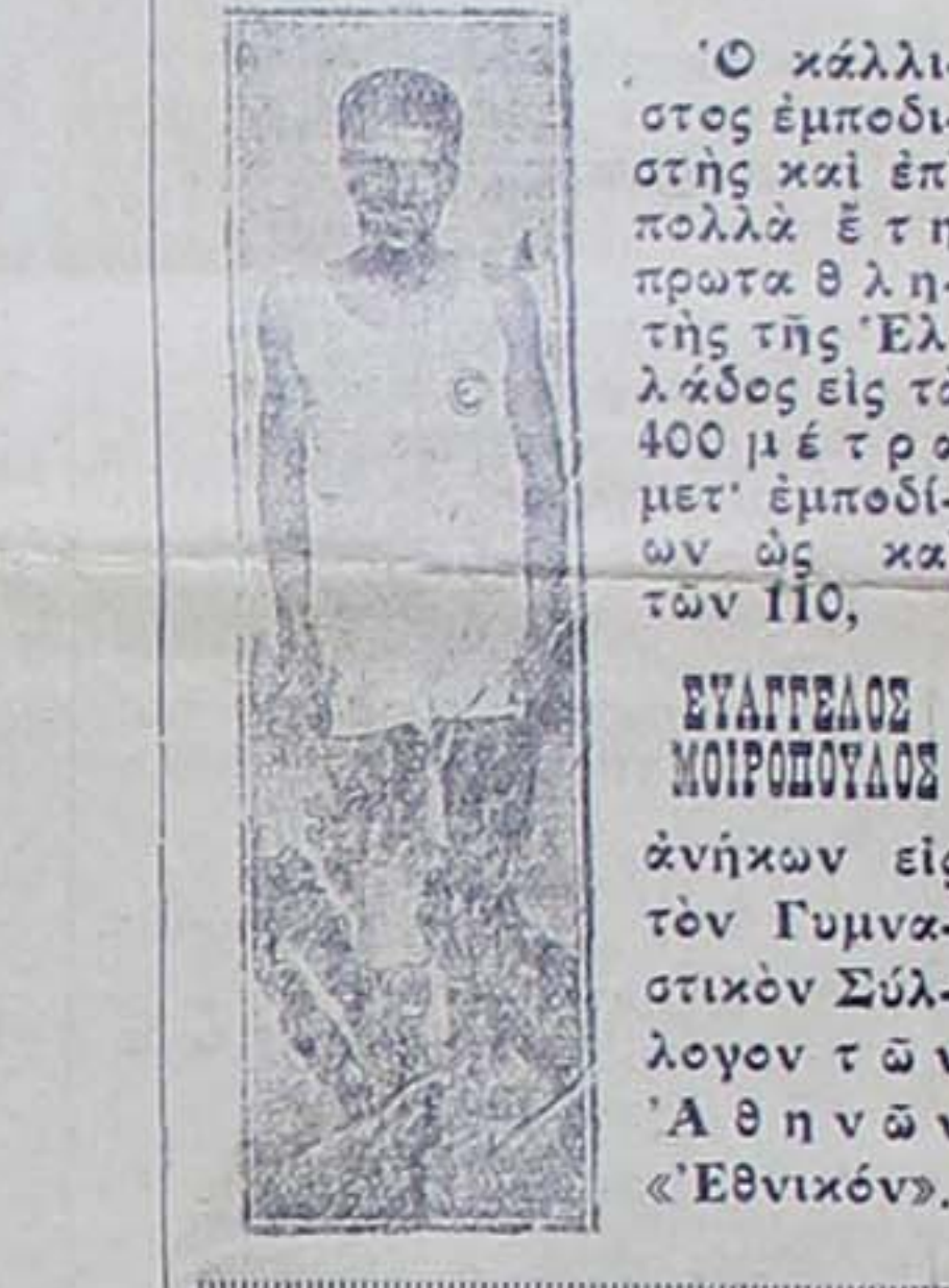
Ὁ κάλλιπτος ἐμποδιστῆς καὶ ἐπὶ πολλὰ ἔτη πρῶτα θλητῆς τῆς Ἑλλάδος εἰς τὰ 400 μ. ε. τ. α. μετ' ἐπιποδίων ὡς καὶ τῶν 110.

Τὸ ἀπόγευμα χιλιάδες λαοὺ συνέρευσαν σὲν γήπεδο γὰρ τὸν πρῶτον ἀγῶνα Α' κατηγορίας μετὰ τὰ ὄμαδων Αετοῦ-Λαίλαπος. Στὴν εἰσοδὸ ἀτάξια γενική καὶ αἱ εἰσπράξεις ἐγένοντο λίαν πλημμελῶς. Παρενηθῆν δὲ καὶ ἀφθονοὺς εἰσοθὴ «εὐκαταχθῶν» καὶ ἰδιαίτερα τῶν ὄρατων φίλων τοῦ «Λαίλαπος», τὸ ὁποῖον σχεδὸν εἰσῆλθεν δωρεάν πρὸς ὄψαν ὡν φροσῶνται τὴν εἰσοδὸν τῆς «Εμ