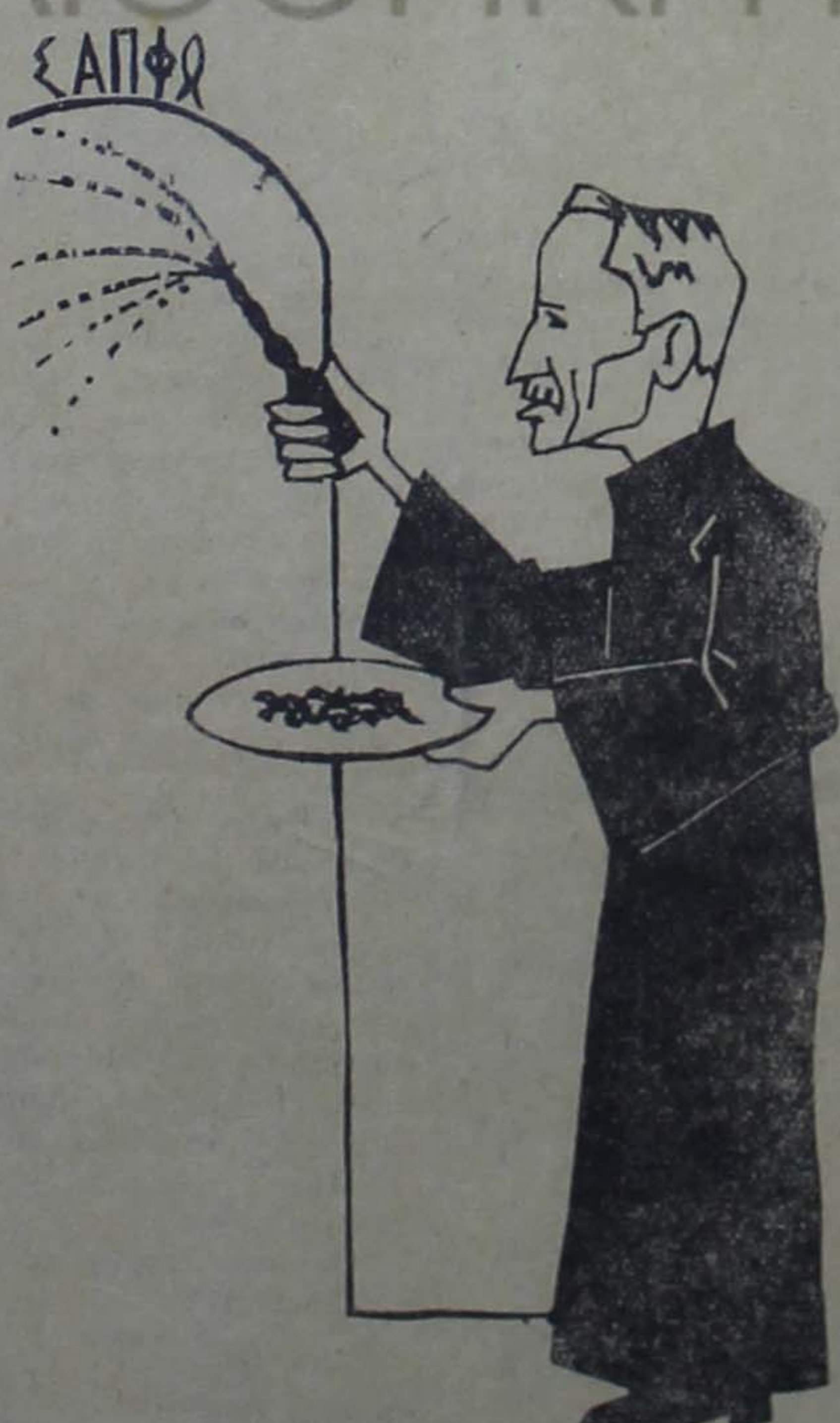
— Περάστε άδελφοί Χριστιανοί... «Τά πάθη του Χριστου» βοήθειά σας!...

ΤΥΠΟΙΣ ΚΥΛΛΙΤΕΧΝΙΚΟΥ ΤΜΗΜΑΤΟΣ "ΔΗΜΟΚΡΑΤΟΥ,,