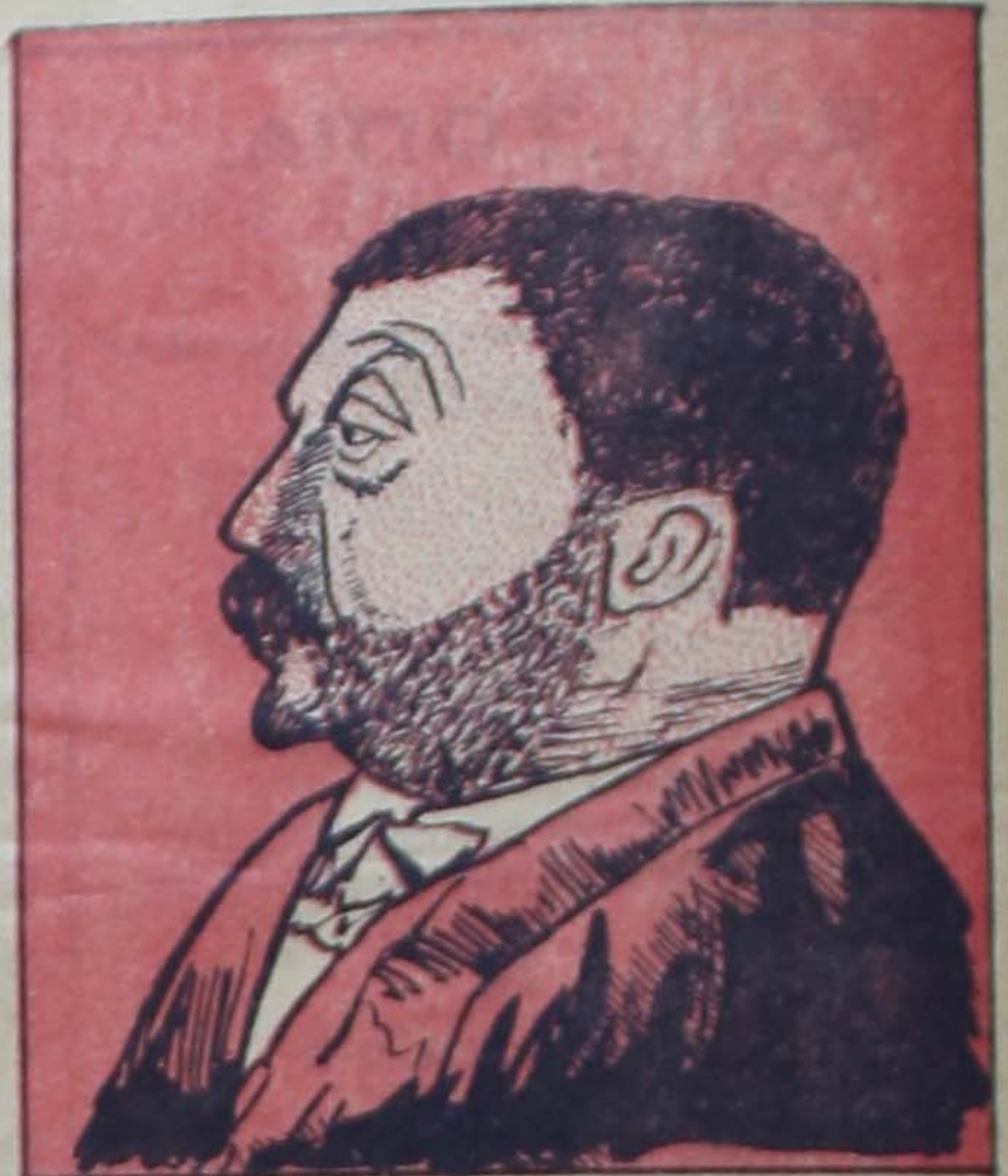
Τύπος.. καλλονής εξαισίας και σπάταλος μέχρι άπελαισίας!...