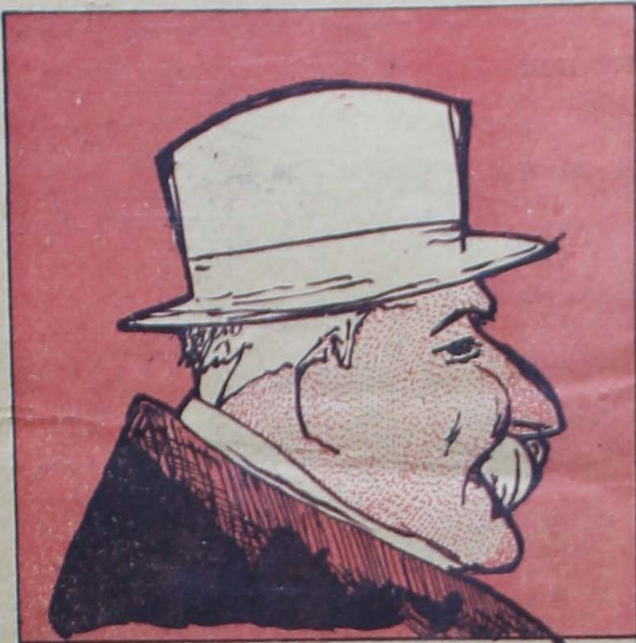
Τύπος τζουμερτιάς εύφημου και.... μέγας δωρητής του Δήμου