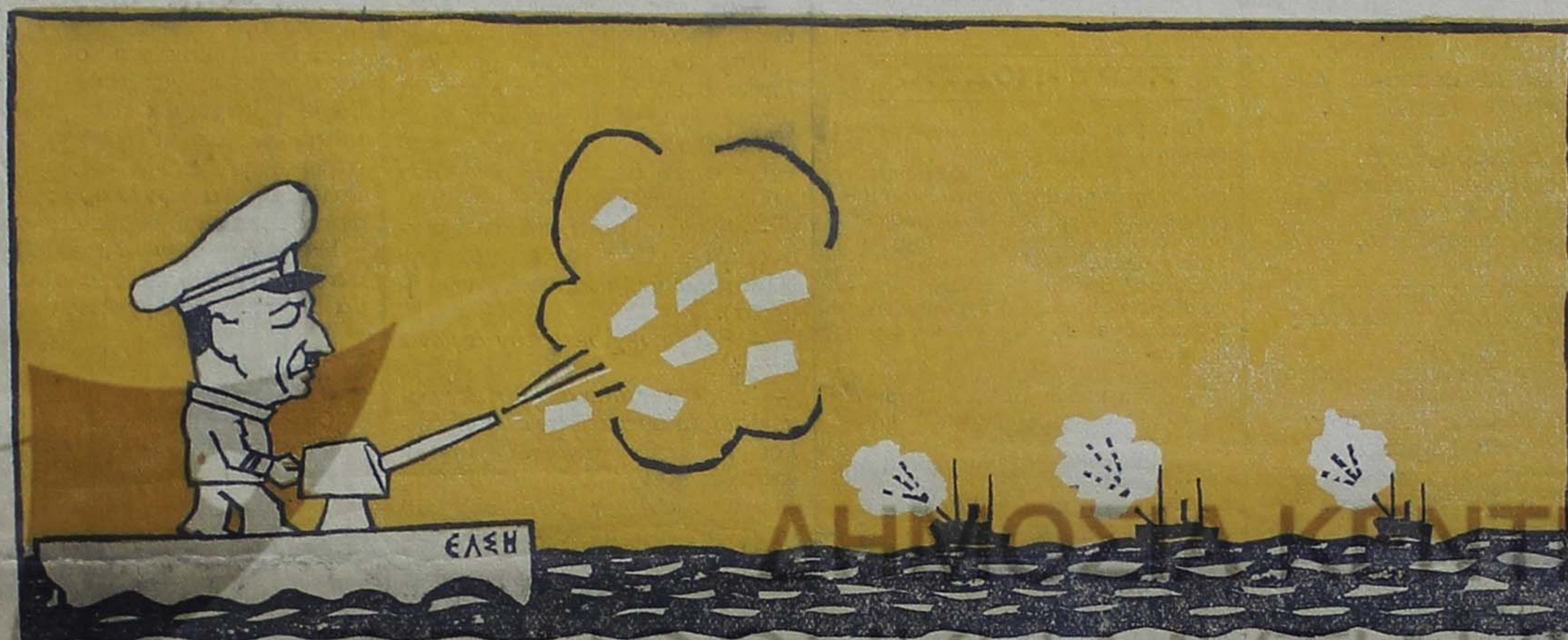
Ο μέγας ναυμάχος του στόλου της άκτοπλοίας.