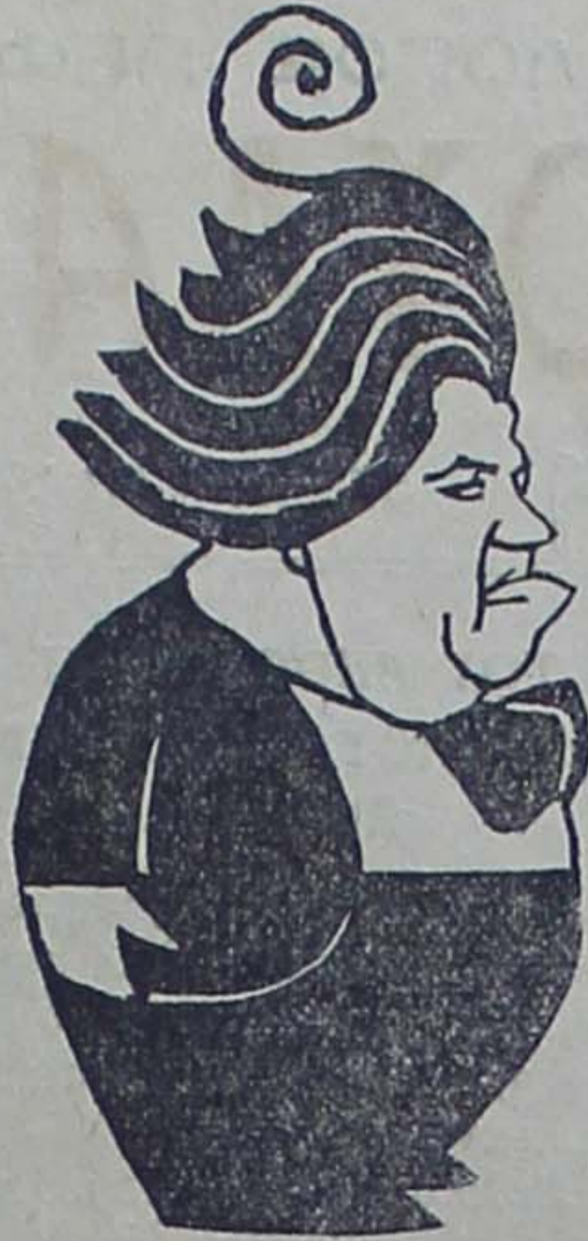
Διακοσμησηκή στήλη της 'Αγροτικής 'Εορτής.