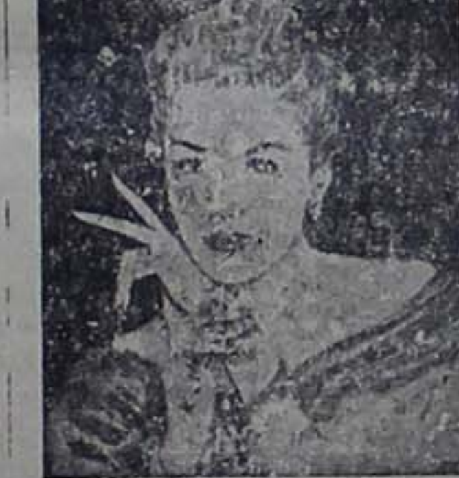
Πρακτική συμβουλή στις γυναίκες πού δεν μπορούν να χάσουν ποτέ άλλημια στην περιποίησή της συροφίας τους.

Μπορείτε να ΕΙΣΘΕ ΩΡΑΙΑ ΧΩΡΙΣ ΚΑΚΙΓΙΑΡΙΣΜΑ