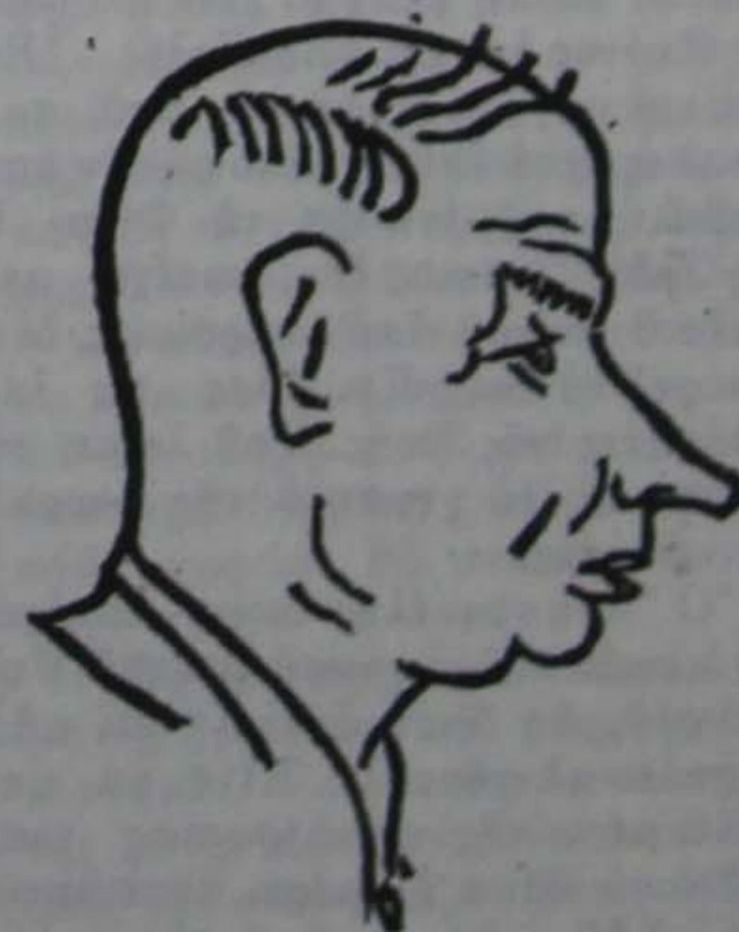
Που είνε τόν τουφέκι του;