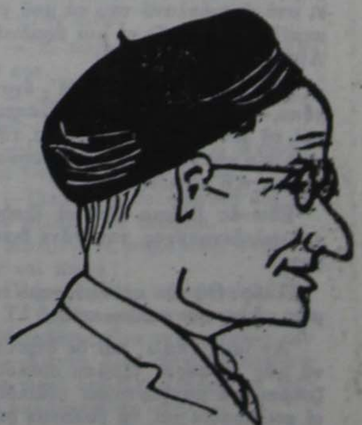
(Σκίτσο τ' ά κ. Θ. Τυραβέλλη Λινόλεουμ κ. Γ. Μαλακού)

Ο κ. Βάσος Παπανικόλας παρακολουθεί με ίκανοποίηση τήν άτακτη φυγή τ' ά έχθρου.