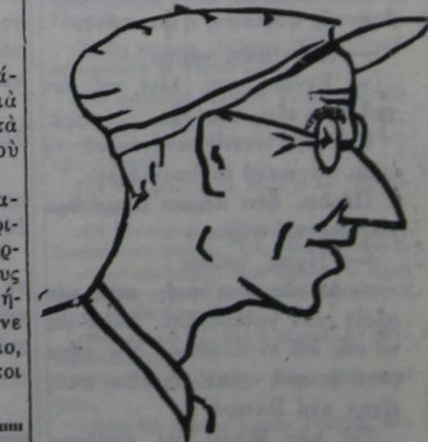
(Σκίτσο τοῦ κ. Θ. Τυραδέλλη Λινόλεουμ κ. Γ. Μαλακοῦ)

Ὁ κ. Ν. Ἀναγνωστόπουλος μὲ τὰ τὸν ἀστοχὸν πυροβολισμόν.