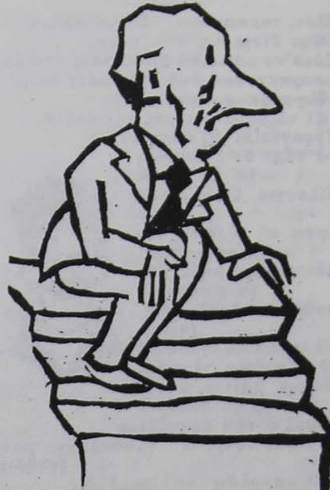
Ὁ κ. Μιχαηλοπούλος, κἀνωχρος ὡς σουδάριον ἐτάπη εἰς ἀισχρὰν καὶ ἐπαίσχυντον φυγήν...» (Τὸν κ. Γ. Γ. Κακαδέλλη)