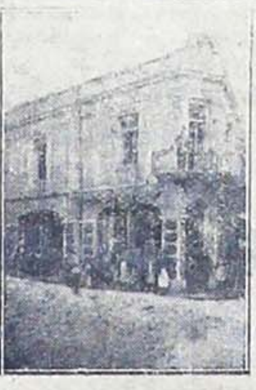
ΓΡΑΦΕΙΑ ΚΑΙ ΚΕΝΤΡΙΚΟΝ ΠΡΑΤΗΡΙΟΝ Ι. ΜΑΤΘΑΙΟΥ