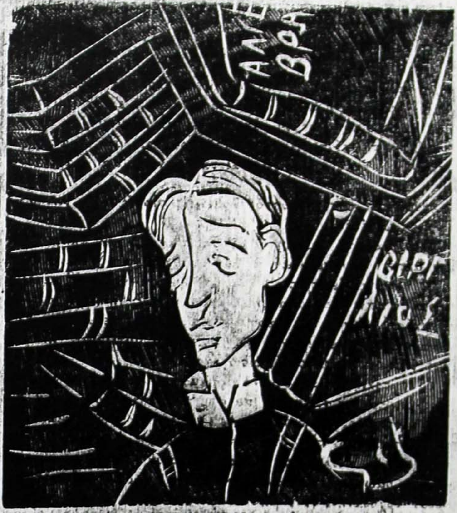
Ὡτ' Φάτσᾶ μαθητοῦ μετὰ τὰ διαμνηστικὰ τῶν ἐξείλωτων.