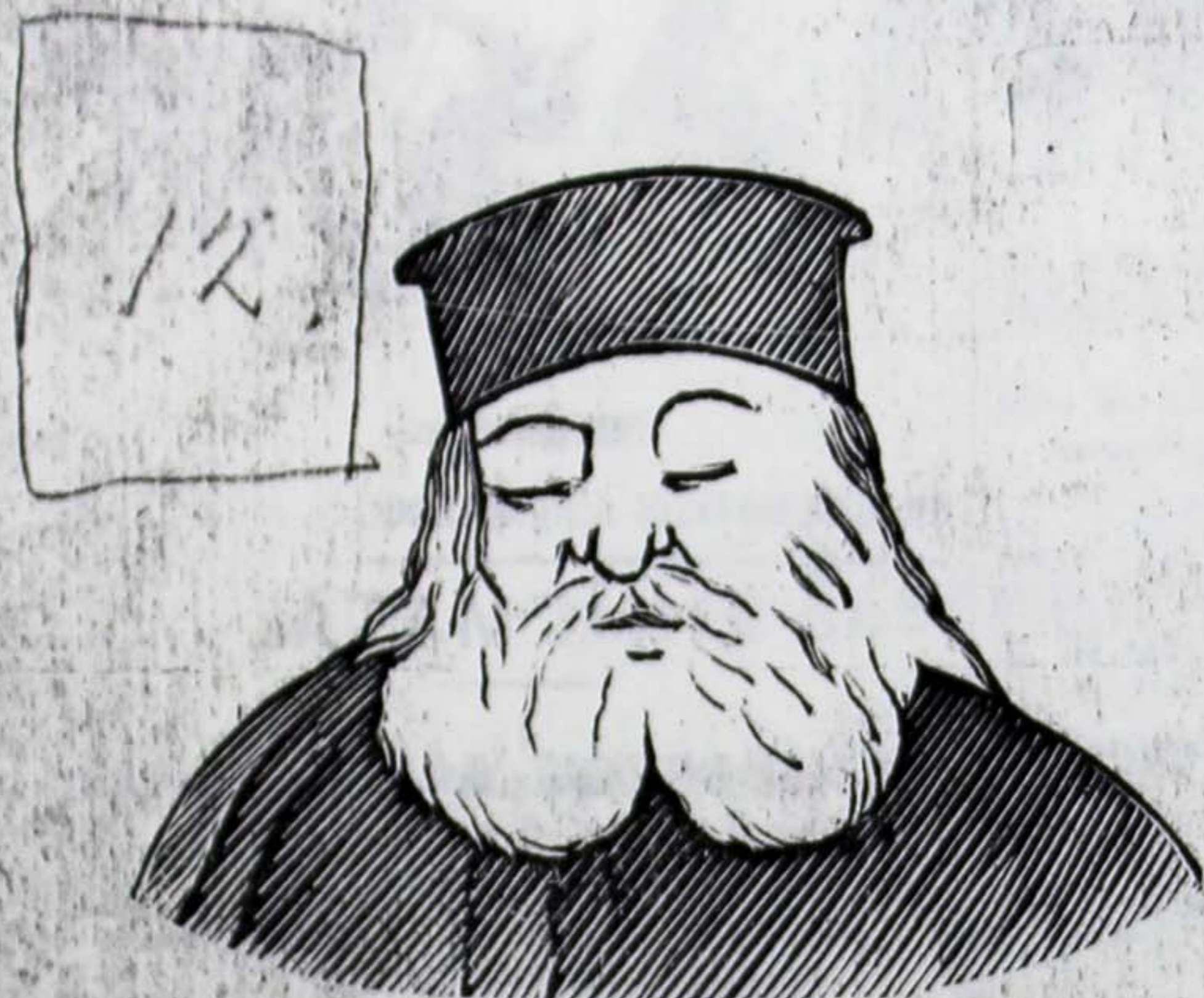
Σιλουέτες από τὰ μοναστήρια.