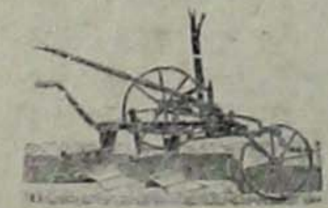
Όδός Χ. Τρικοήπη 6 ΑΘΗΝΑΙ

Ίδίως δέ οι πατριώται οι διαμένοντες εκτός της Άγιάσου έχομεν ύτέροτατον καθήκον να ένισχύσωμεν τό Νοσοκομείον μας, διότι οι έδω διαμένοντες συγγενείς των πολιτρόπως έξυπηρετούνται από τό καλώς διαργανωμένον ήδη έξωτερικόν Ιατρείον του.