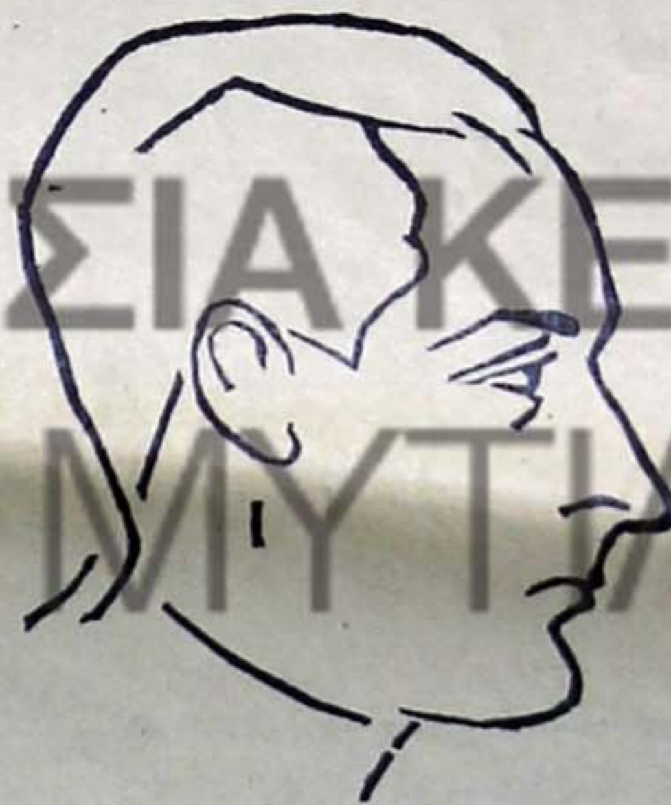
Ὁ κ. Πάνος Πολυπάθου

Σκίτσα κ. Πάνου Ροῦμελη. Λινόλεου κ. Π. Παγωτέλλη