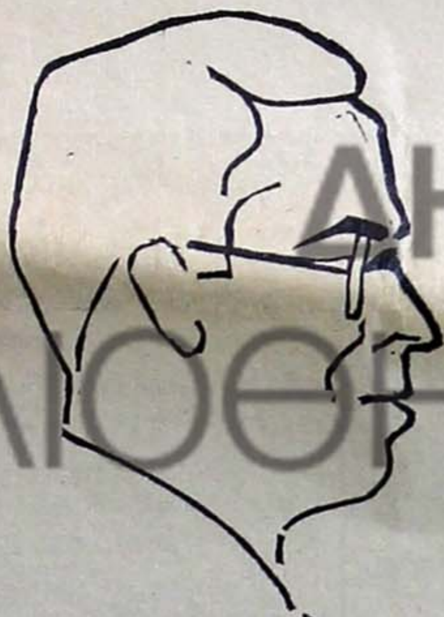
Ὁ κ. Μῆτσος Σκληπάρης