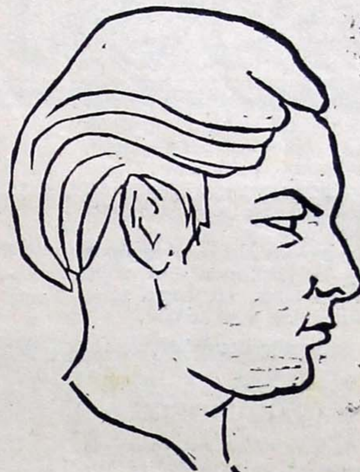
Ἡ Δ)νις Εὐτυχία Χ' Παυλῆ